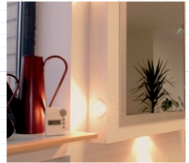
Profil Flansch kombiniert mit integrierter Beleuchtung.